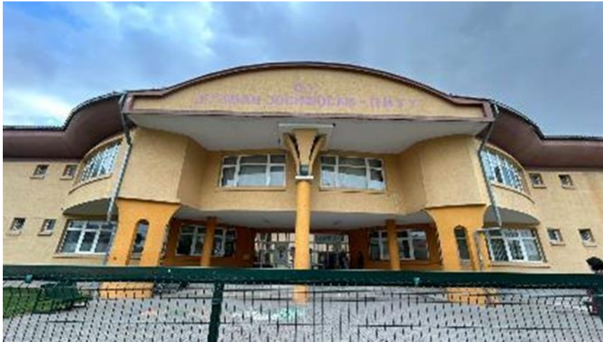
Скопје, јули 2024

Потпроект: Реконструкција на ООУ Кузман Јосифовски Питу во Кичево со мерки за енергетска ефикасност