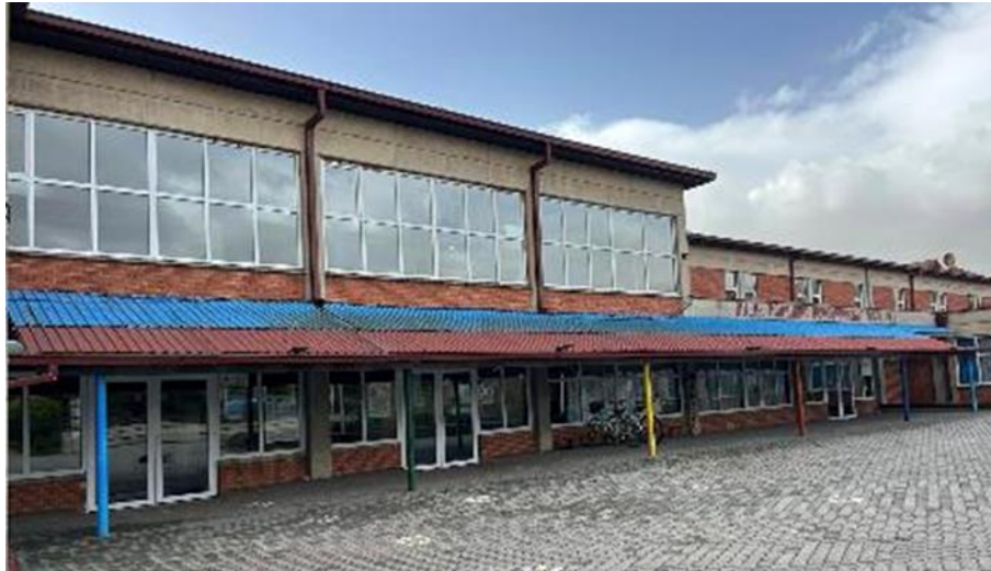
Скопје, јули 2024

Потпроект: Реконструкција на ОУ Д-р Владимир Полежиноски во Кичево со мерки за енергетска ефикасност