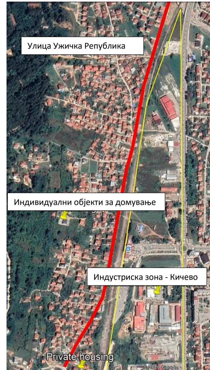
Слика 2 Локација на реконструкција на улица “Ужичка Република”